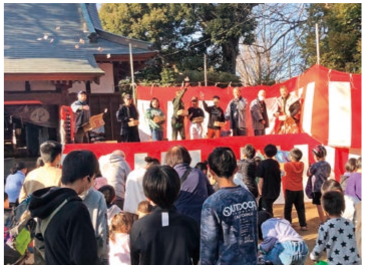
節分祭追儺式(つくばみらい市小絹八坂神社)