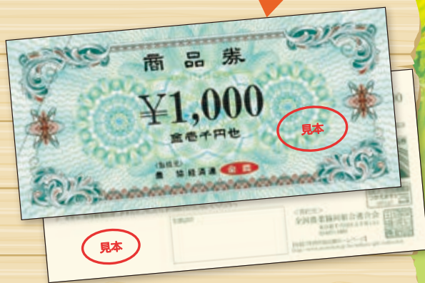
※当選本数は15億円(5ユニット)を販売した場合です。