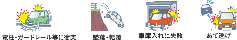
電柱・ガードレール等に衝突